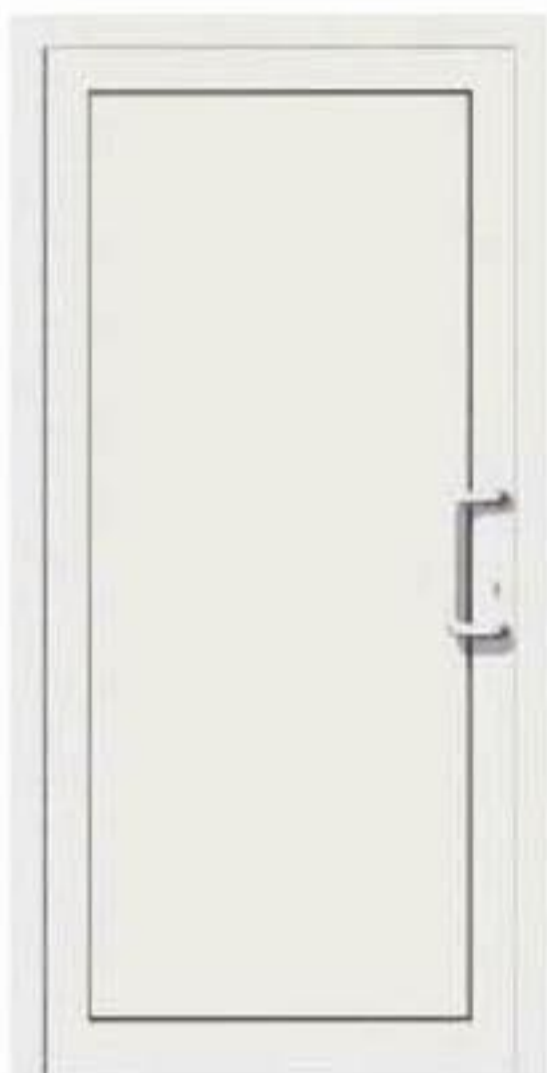
model S 000