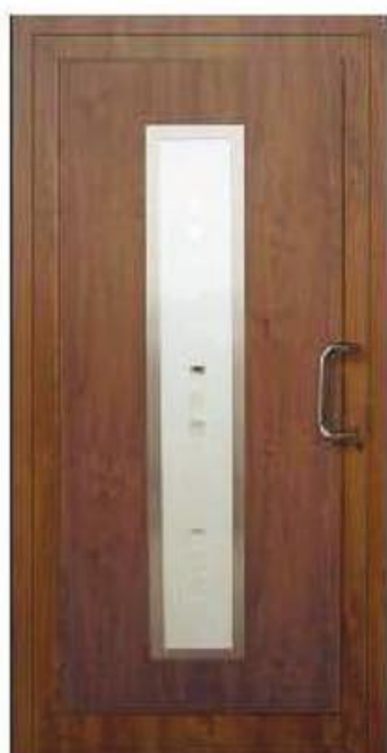
model S 02