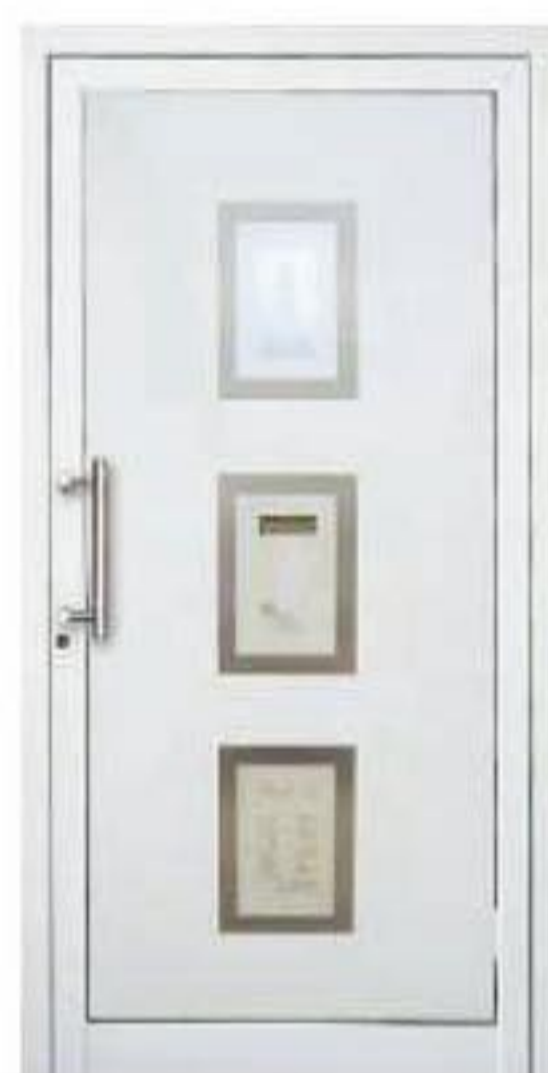
model S 03