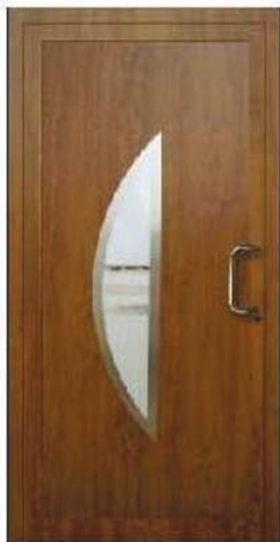
model S 01