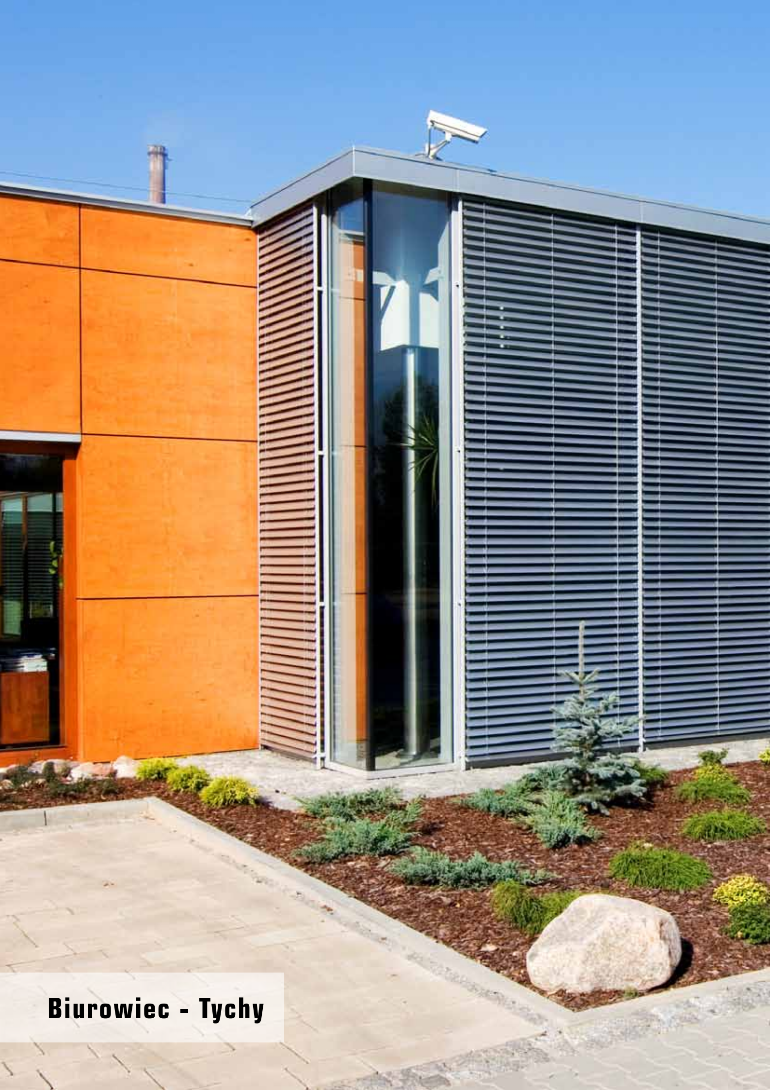
Biurowiec - Tychy